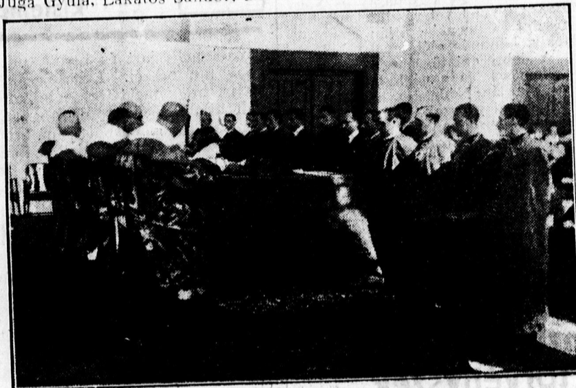
Pénteken tizenegy doktort avattak fel az egyetemen