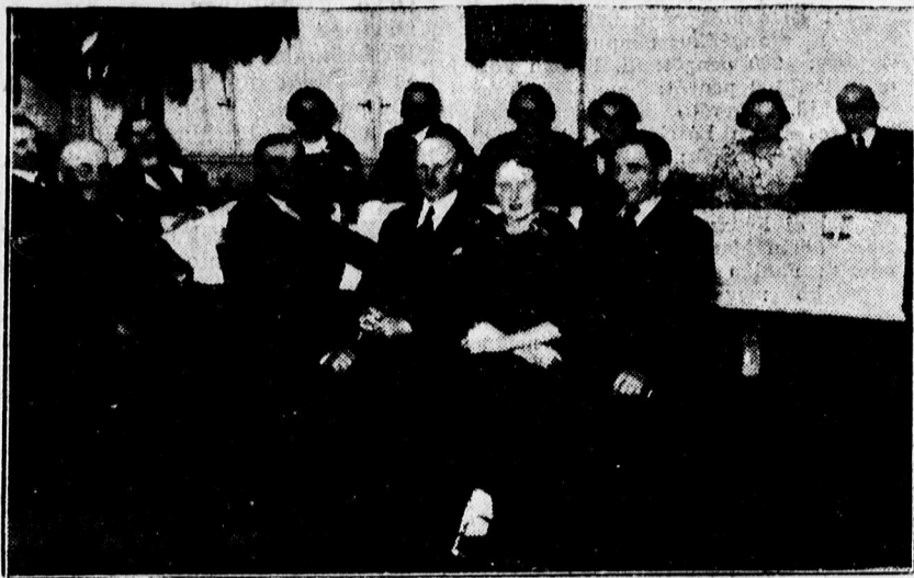
A vasútasok „Szárnyaskerek” egyesületének családi estje