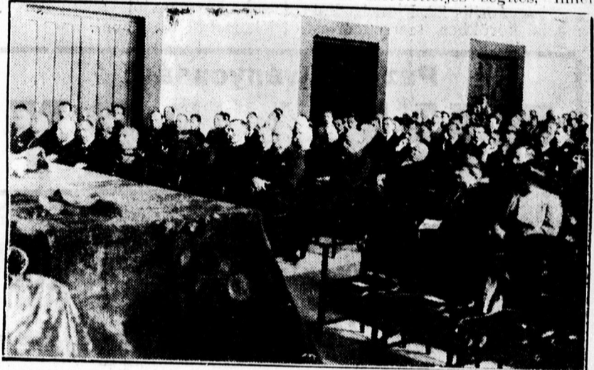
Tisza-ünnepély közönsége

— Tisza István politikai működése, egyházi és más közszereplése híjjával volt minden olyan eszköznek, amely az ő népszerűsítésére alkalmas lett volna. Ellenkezőleg, az ő férfias felelősségvállalása az államélet komoly fázisaiban, szívós kitartása, bámulatos küzdőképessége fenkölt céloknak szolgálatában nélkülözött minden