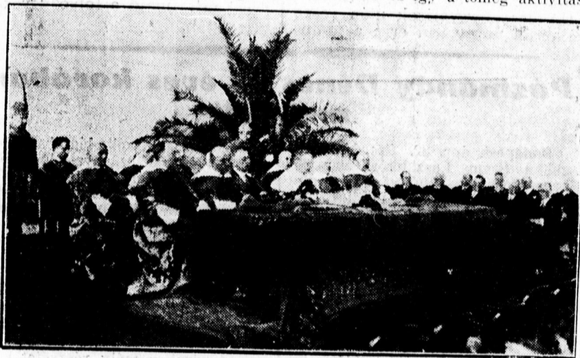
Tisza-ünnepély az egyetemen

vonás az, amelyet a belső titkos találkozásból hozott magával, ebből árad valami olyan atmosféra, amelyet csak az hozhat magával, aki nagy mélységből jött elő. Tisza a legmélyebbható, féltelmes intelligencia megtettesült alakja. Mások az erőt tartják benne mindenek fölötti tulajdonságnak. Tisza István egyéniségének jellemvonása még az önfeláldozásigmenő szeretetteljes segítés, innen