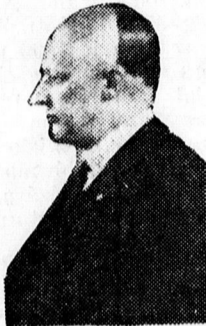
báró Vay László főispán

A Nemzeti Egység Pártja, mint ismeretes, a város különböző részeiben olvasótermeket létesített. Legutóbb került sor az első városrész negyedik körzetében arra, hogy az olvasótermet megszervezzék és rendeltetésének átadják. A szépen felszerelt olvasótermet vasárnap délután 4 órakor nyitotta meg nagy érdeklődés mellett báró Vay László főispán. A megnyitáson báró Vay László főispán kíséretében meg-