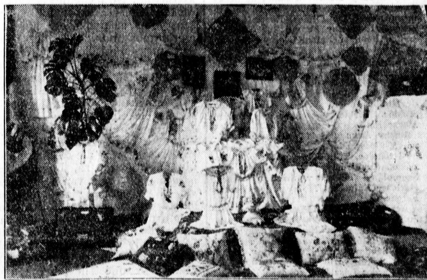
Rajz- és kézimunka kiállítás a Sycetits Liceumban

A közigazgatási bizottság a jelentéseket tudomásul vette.