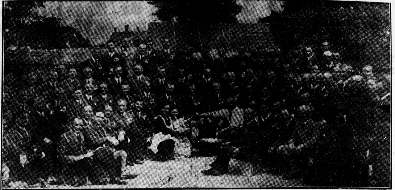
A Frontharcos Szövetség debreceni csoportja a hajdúsámsoni Hősök szobrának leleplezésén