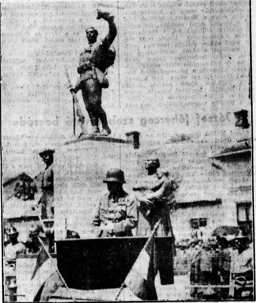
József főherceg fölalta tja a hősök szobrát