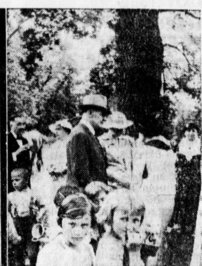
A kicsinyek jóltevéik körül.