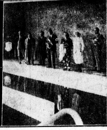
Ujságírók a fedettuszodában