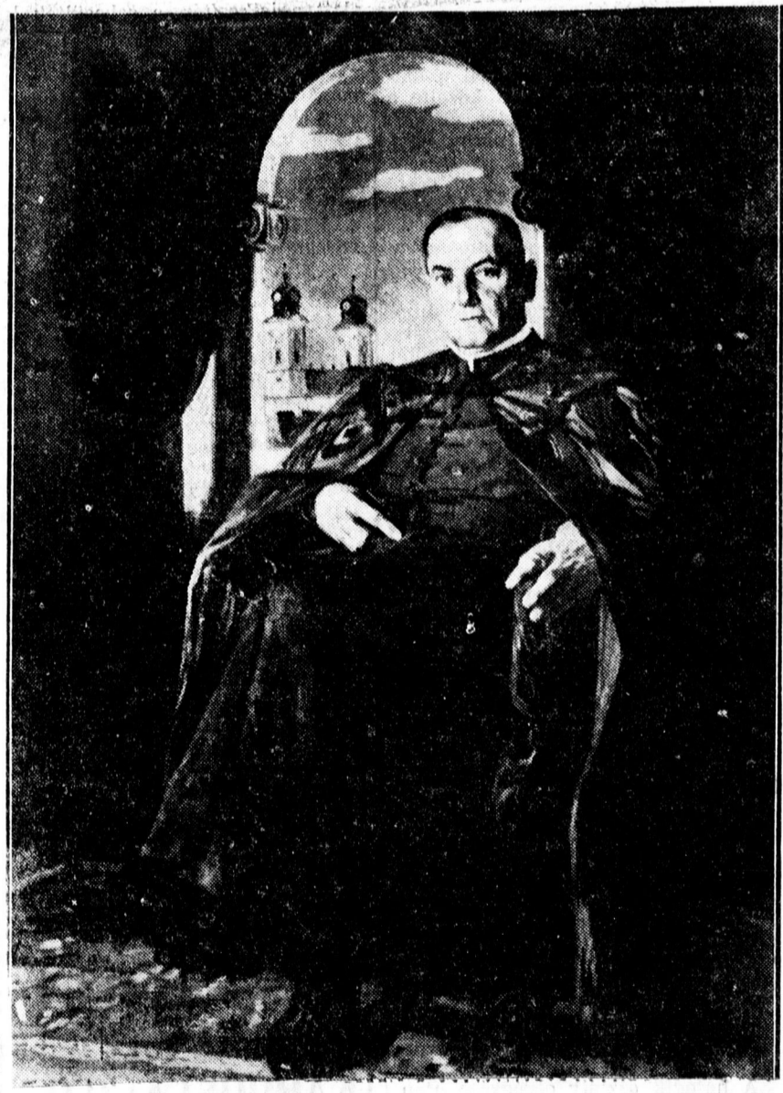
DR. BALTAZÁR DEZSŐ 1871—1936

Igy virradt kedd reggelre a válságos órákat élő dr. Baltazár Dezső. Az aggodalom a beteg sorsáért