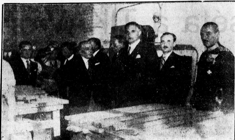
Bornemisza Géza miniszter a Baross Gábor Kör famegmunkáló telepén

LAPUNKAT TÁMOGATJA, HA HIRDETŐINKNÉL VÁSÁROL