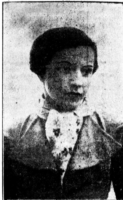
Elek Ilona a törvívás olimpiai bajnoknője, mint idegenvezető Debrecenben.

Lapunk munkatársának alkalma volt beszélgetni Elek Ilona olimpiai bajnoknővel, aki mint idegenvezető jött el az olaszokkal. A harmadik emeleten lévő lakosztályán kerestük fel. Már előre