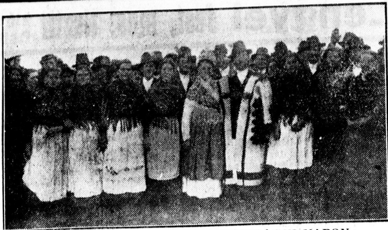
LAKODÁLMAS MENET A HORTOBÁGYI NAPON

folylak a gyorsírók és gépirónok szakszerű kiképzése. Tanfolyam után állami vizsga, államérvényes bizonyítvány. — Helyesirástánítás,