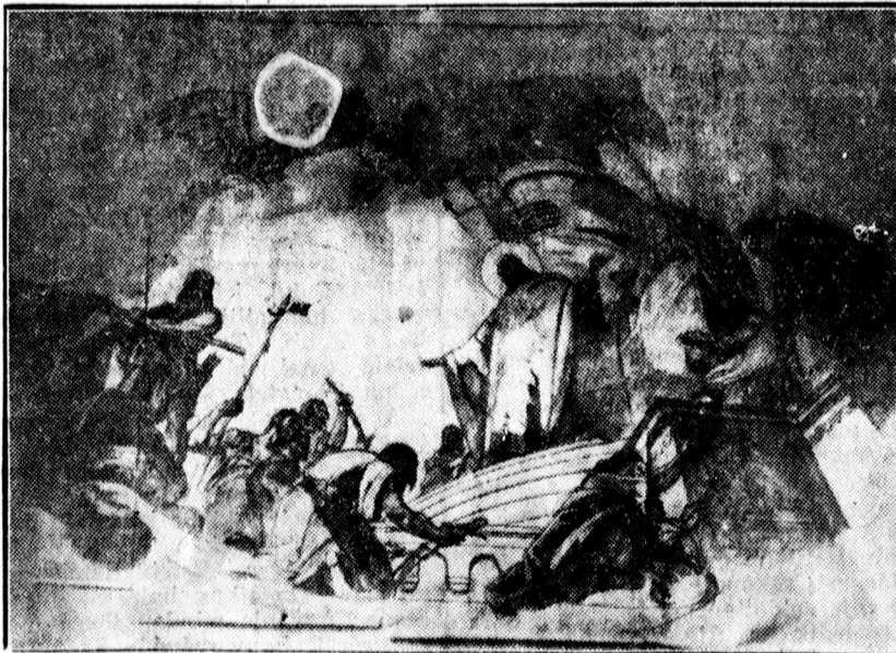
Szent István előtt meg hódolnak a pogányok