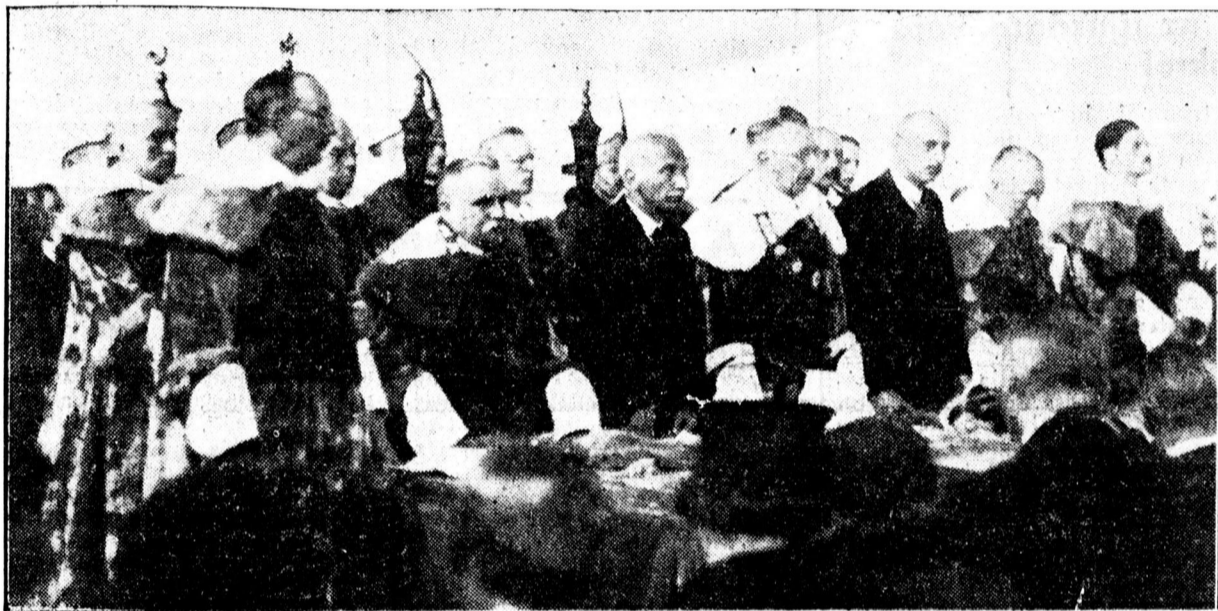
EVNYITÓ ÜNNEPELY AZ EGYETEMEN

Beszédének elején az egyetemnek nagynevű, örökemlékü alapítójáról és névadójáról emlékezett meg. Ferenc József dicsőséges uralkodásáról szölt, akinek nemes elgondolása tette lehetővé, hogy ez az egyetem, így ahogy van, létrejöhetett. Ami maradandó lett a korból, az most kezd kibontakozni a kultúra és a szellem alkotásain keresztül. Mikor azonban az aggyastán vállal nem bírták a terhet, adott a Gondviselés egy oszlopot mellé, Tisza István grandiózus alakját. Ő a magyar génus inkarnációja volt. Amit az uralkodó jóakarát elgondolt, szépek talált, azt Tisza István valósi