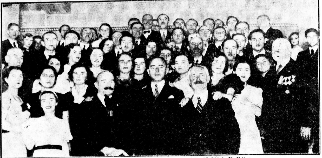
Az 50 éves jubileumát ünneplő Kereskedő Ifjak Dalköre