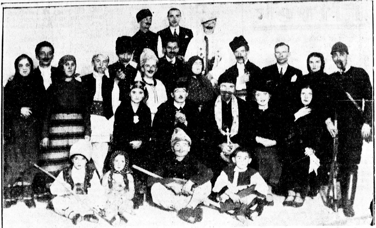
Az egyetemi áltisztek műkedvelő együttese nagy sikerrel adta elő az Elnémult harangok című színművet

— Hölgyek! A Tonal hajfesték 18 színárnyalata biztosítja a természetű hajfestést. Fodrászától követelje.