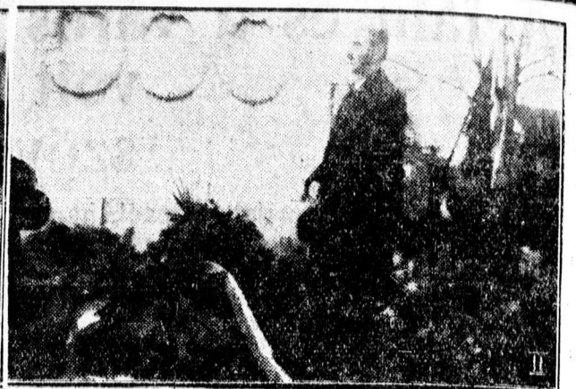
A Hősök emlékművének megkoszorúzása.