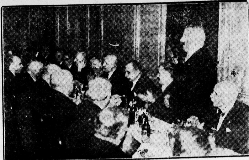
A Nemzeti Egység szesznyító vacsorája az Angol Királynőben

— Rádiókészüléket Orion — Phi- lips — Eka, s az összes gyártmá- nyok díjmentesen, vételkötelezett- ség nélküli bemutatása. Kerékpárok az összes magyar és külföldi gyárt- mányok, Csepel-motorok , alkatrés- zek nagy raktára és Service állo- mása. KIRÁLY , Royalépület, tele- fonszám 20-66.