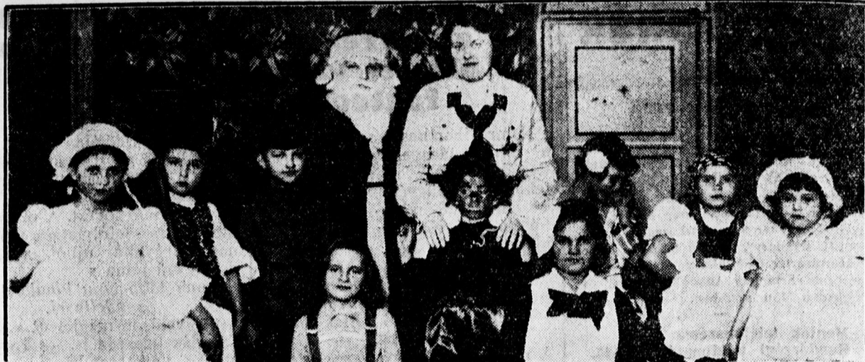
Az evangélikus iskola Miklós-napi szereplői

— Szombaton lesz a gyorsíróverseny a Kereskedelmi Akadémián. A Debreceni Gyorsírók Társasága szombaton, december 12-én, karácsonyi gyorsíróversenyt rendez a Kereskedelmi Akadémián. (Piac-utca 8.) termében. A verseny pontban 3 órakor kezdődik 60—80—100—120—150—200—250—300 szótagos versenyfokokkal. A 60 és 80 szótagos szabatos írás versenyeken nem kell átvenni a szöveget közönséges írásba. December 13-án, vasárnap írói gyorsíró és gépiró állampvizsgák lesznek Debrecenben. A versenyek részletes eredményeit december 17-én, csütörtökön d. u. 4 órakor hirdetik ki a Kereskedelmi Akadémia dísztermében. Ekkor tartja a Debreceni Gyorsírók Társasága évi rendes közgyűlését, amelyen dr. Naményi Gyula tanár előadást tart „A gyors- és gépirók munkájának értékelése” címen. Ekkor osztják ki a versenyzők okleveleit is. A Debreceni Gyorsírók Társasága tanfolyamai megkezdődtek a Mansz helyiségében. Piac-u. 36. szám.)