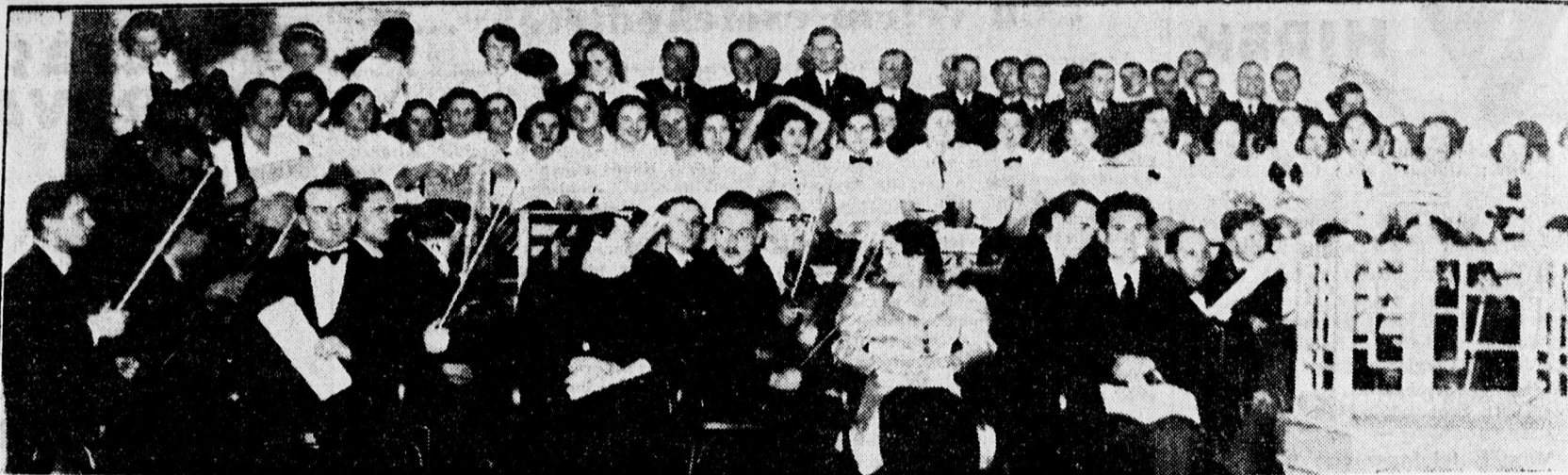
A Szenci Molnár Enek- és Zenekar az Arany Bika-szálló disztermében