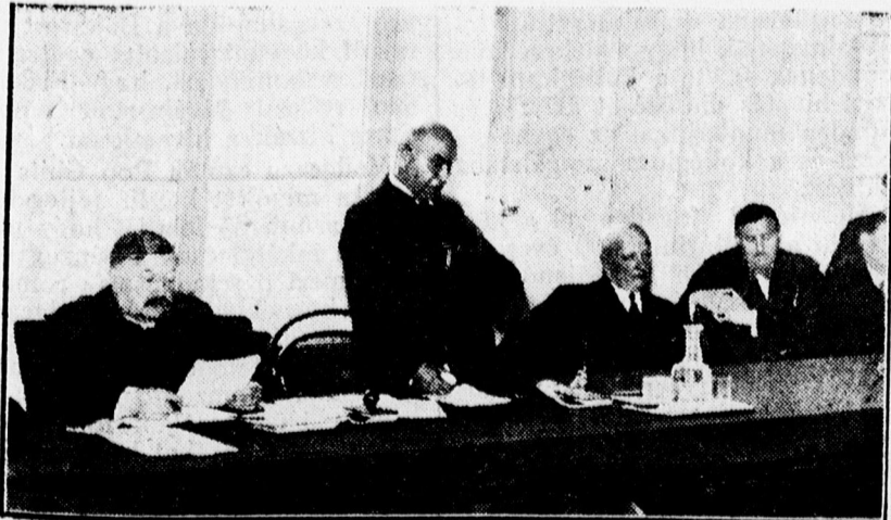
Maklár Károly püspök válaszol az üdvözlésekre

dagodás forrása az a bizalom és szeretet, amely Méltóságod fennkölt lelkéből állandóan felém sugárzik és amelynek birtokában én kimondhatatlanul boldognak és rendkívül gazdagnak érzem magamat.