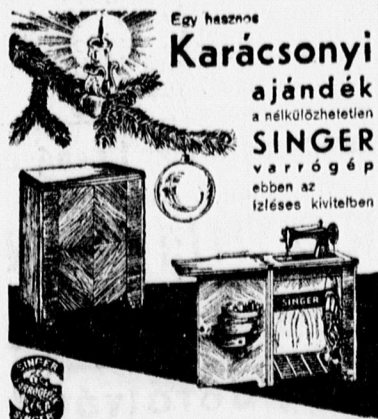
SINGER VARRÓGÉP RÉSZV. TÁRS.

illatszertárában, Batthyányi uca 17/19. sz. alatt mindenféle pipercikkek, karácsonyfadíszek és karácsonyi ajándéktárgyak nagy választékban kaphatók.