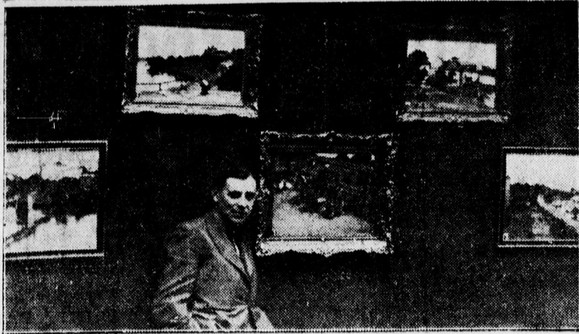
Ma zárul Bányász István kiállítása a Déli-múzeumban