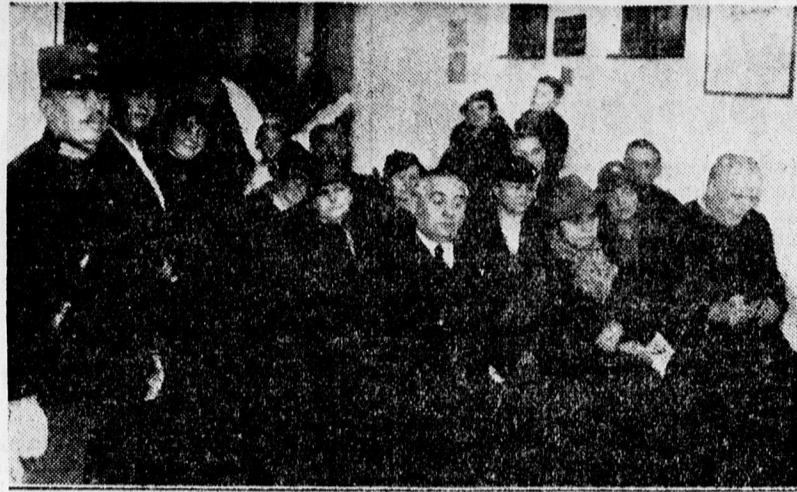
A fogház karácsonyi ünnepélyének vendégei