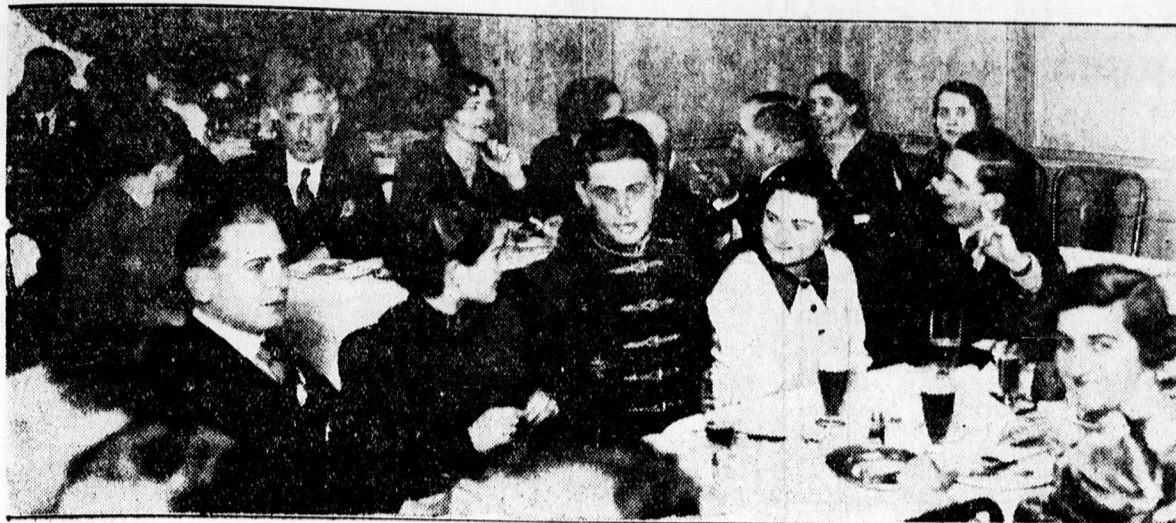
A Postás MANSz társasvacsorája az Angolban