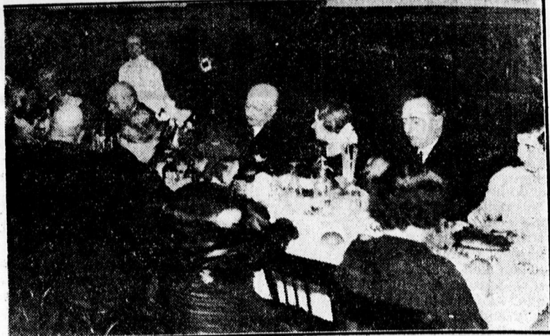
Báró Vay László államtitkár az ünnepi banketten