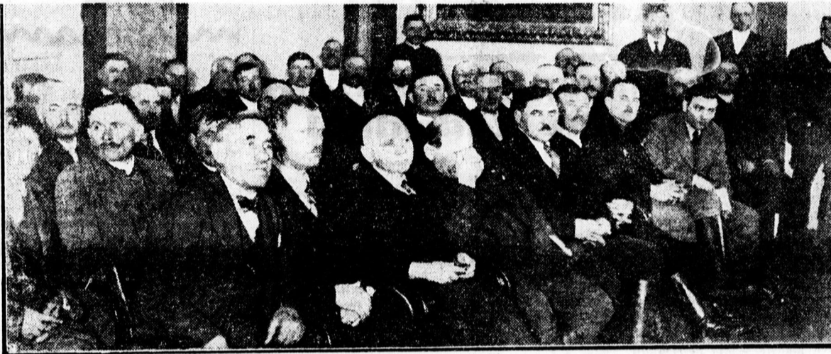
A Gazdasági Egyesület tisztújító közgyűlése

Vasárnap este nyolc órakor az Angol Királynő külön termében társasvacsorára gyűltek össze a