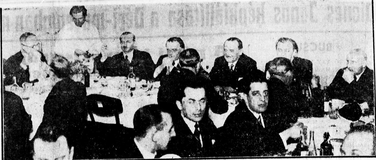
A Takarékoság R. T. jubileumi vacsorája az Arany Bikában

A németeknek szükségük van löheremagra, valamint hiborheremagra, szűszűhűhűkőnyre és egyéb elkkre. A magyar árköveteléseket a németek ezekben a cikkekben egyelőre megadni nem hajlandók, mielőtt is tárgyalások akadozva haladnak előre. A magyar kívánságok, az árak kérdésében igazságosak: az exkluzív viszonylatokban olyan árak érhetők el, melyek semmi esetre sem teszik indokolttá, hogy a németek a kért árakat meg ne fizessék. A tapasztalat azt mutatja hogy ezek a tárgyalások végeredményben megengedése fennak vezetni és a magfellekkelmi körülményben úgy látszik, hogy a magyaros havában Németország felé még túlbővülő magfellekkelmi kiszállítások lesznek.