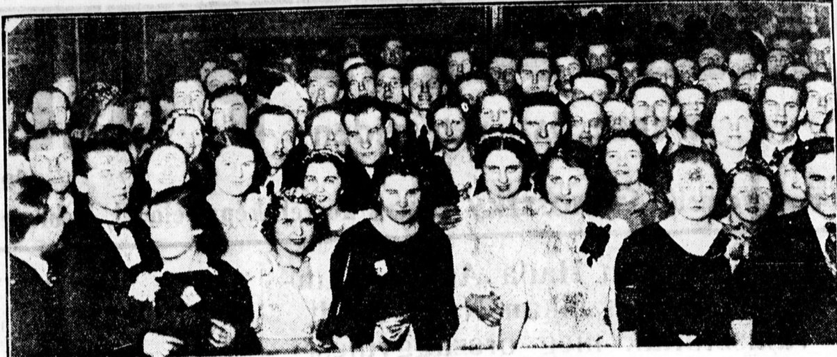
Kereskedelmi Alkalmazottak Egyesületének bálja

— Családi Arany-est a Kollégium dísztermében. A piacutcai leánykör tagjai eddig csendben, hangtalanul végezték áldásos, szegényeket, beteget, özvegyeket és árvákat gyámolító munkájukat. Most végre nyilvánosság elé lépnek. Február 7-én, vasárnap este 6 órakor irodalmi estet tartanak a Kollégium dísztermében. Az estet Uray Sándor, az újonnan megválasztott püspökhelyettes nyitja meg. Utána pedig Kőncz Aurélné ny. Dóczi-intézeti igazgatónő tart előadást Aranyról. A gazdag műsorú irodalmi estre felhívjuk olvasóink figyelmét.