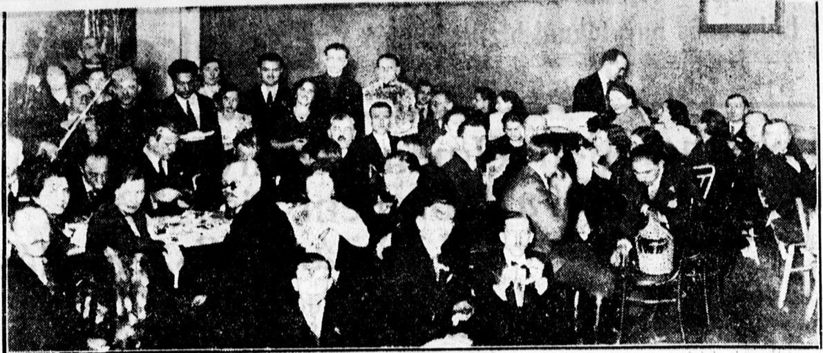
A csizmadiamesterek báljának közönsége