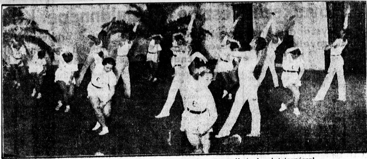
A DEAC március 13-án rendezendő disztornaünnepélyének mintatornászai

Ezután dr. Mendöl Tibor egyet. tanársegéd beszélt a Tiszántúl település földrajza és település történetéről mintegy bevezetésként a település földrajza, település történet és etnográfiai összefüggéseire vonatkozólag tett igen értékes megjegyzéseket, aztán ráért azokrak a tényezőkre az ismertetésére, amelyek a település létrejötténél számításhoz jönnek. Azután a Tiszántúl település történetének fejlődését vázolta a hallgatóság előtt. A Tiszántúl szerinte egészen új lakosságot kapott a kunok, a jászok, a hajdúk mind az elpusztult ősi magyarság helyére települtek. Nagy érdeklődéssel hallgatta a közönség azokat a szavakat, amelyek az újabb fejlődéssel kapcsolatosan a tanyavilág létrejöttéről s mai helyzetéről vonatkozólag mondott. A tanyakérdés, voltaképpen útkérdés s ma, amikor már tények előtt állunk,