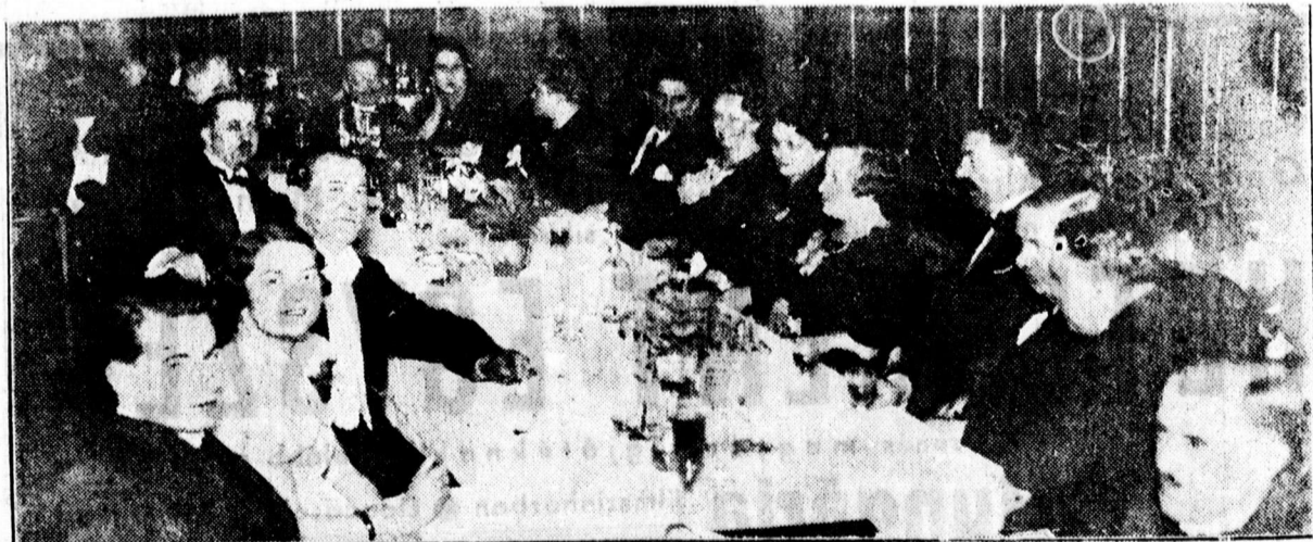
Suppé a vendéglősbálon: az Elnökség asztala