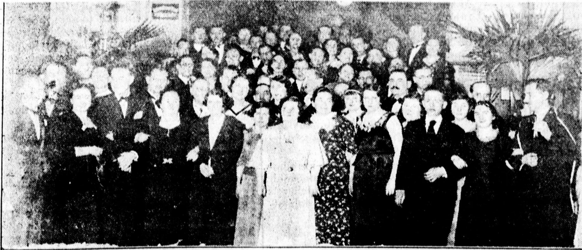
A vendéglősből közönsége az Arany Bikában