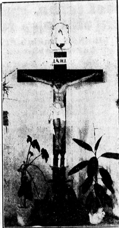
A rabok által készített feszület