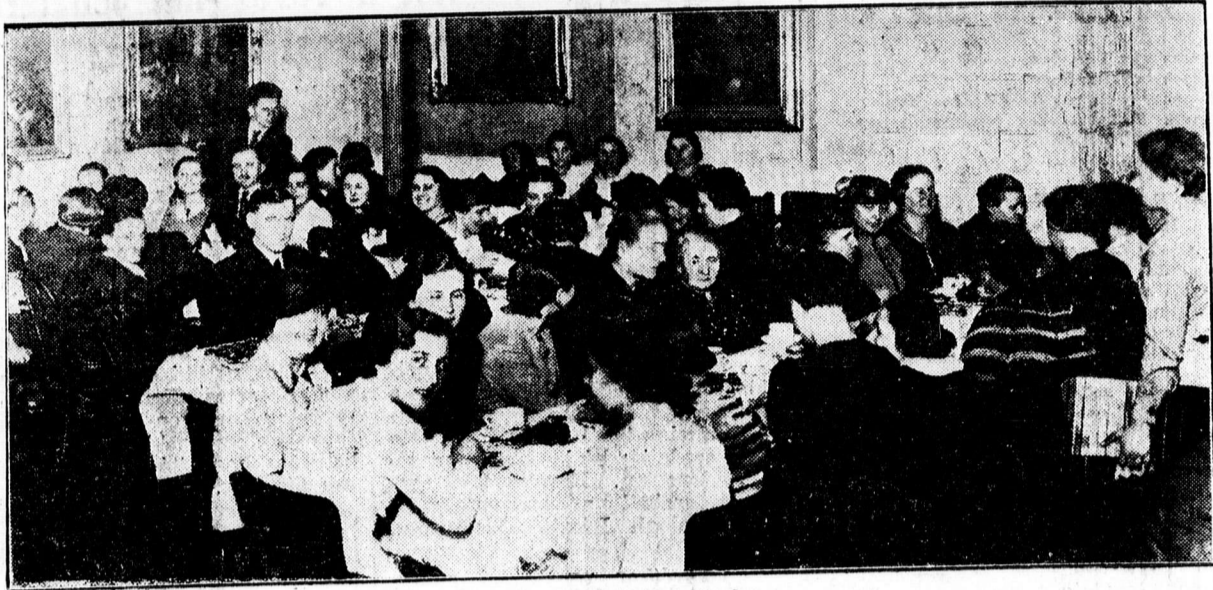
A KIE teastéjének közönsége