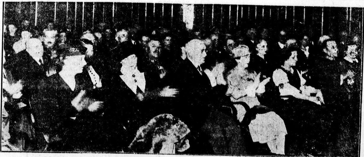
A Székely Társaság előadásának közönsége az Arany Blkában