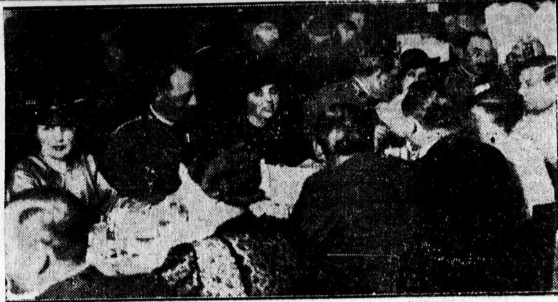
A galamblövő verseny résztvevőinek bankettje az Arany Bikában