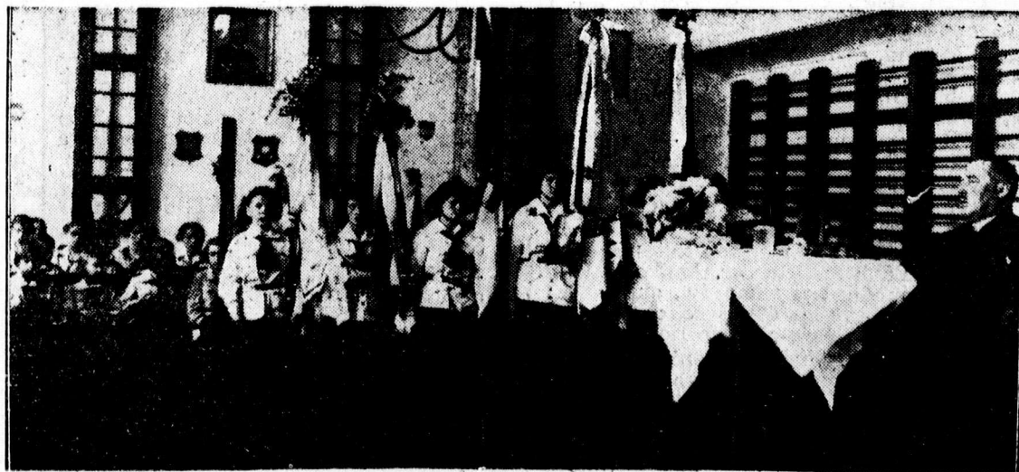
Cserkészavatás a Dócziban