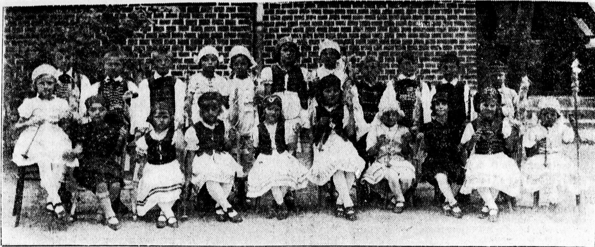
A sámsoni úti állami iskola Ifjúsági Vörös-Kereszt csoportja előadásának szereplői

— Tornabemutató. A négyévfolyamú női felső kereskedelmi iskola 1937 június 6-án, vasárnap délután 4 órai kezdettel a DEAC-pályán tornabemutatót tart. Műsor: 1. Felvonulás. Hímnusz. 2. Az I. A) és II. B) évf. tanulóinak zenés szabadgyakorlata. 3. A II. A) és III. évf. mozgás tornája. 4. 50 méteres síkfutás. 5. A II. B) évf. ritmikus gyakorlata. 6. Az I. A) és I. B) évf. labdastaféja. 7. A II. A) évf. labdagyakorlata. 8. Vivás. 9. A IV. évf. buzogánygyakorlata. 10. A II. B) évf. magyar tánc. 11. A II. A) évf. játéka (küllőverseny). 12. A III. évf. tánc (valcer). 13. Előkép. Hiszekegy. 14. Elvonulás. Belépőjegy ára 50 fillér (páholy és I. sor), 30 fillér (a többi sorban) és 20 fillér (állóhelyen). A tornabemutatóra az iskola igazgatósága szeretettel hívja meg az iskola barátait és volt tanítványait. (O)