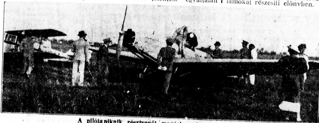
A pilótapiknik résztvevői megérkeznek az epreskerti repülőtérre