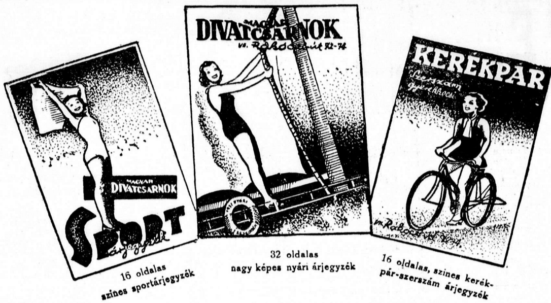
16 oldalas színes sportárjegyzék