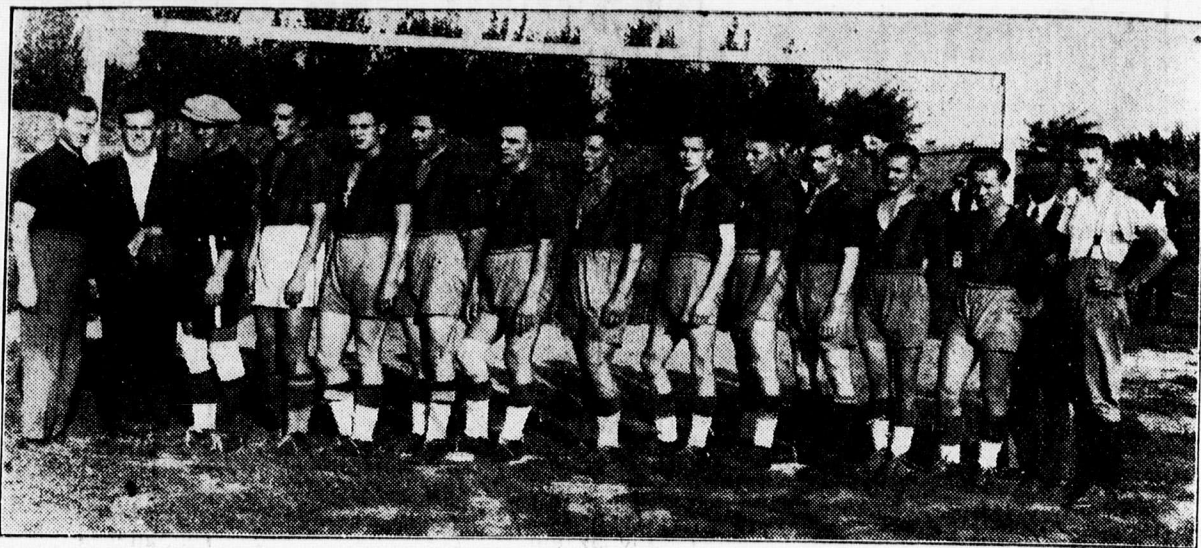
A Balmazújvárosi SC futbalcsapata

— Gőnczi cserépkályhák jók, szépek, kifogástalan hófokúak. Tökéletes munka, olcsó árak. Javítások, átrakások szakszerűen. Monti ezredes-utca 3. (Bejárat a Burgondia-utca felől.)