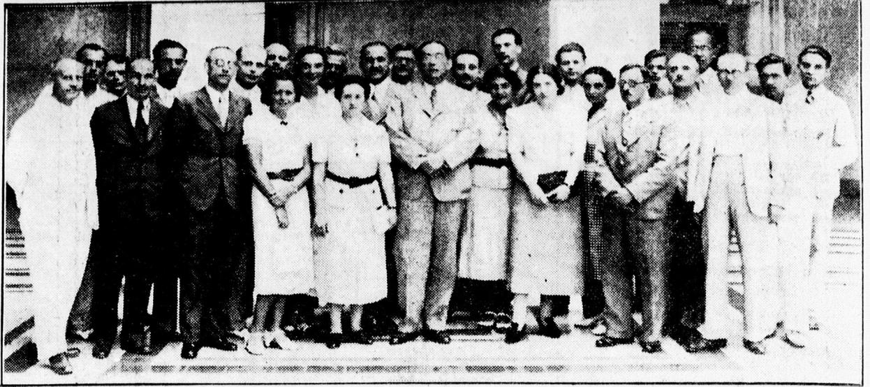
Az olasz továbbképző nyelvi tanfolyam résztvevői