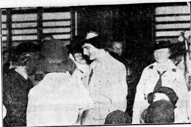
Anna királyi hercegasszony a Dóczi-intézetben.

zeum igazgatója ismertette a kép rövid történetét és az ábrázolt alakokat, a királyi hercegasszony nagy érdeklődéssel tekintette meg előbb a Déri-gyűjtemény műkincseit, különösen a képtárat, majd lejöve az I. emeleten, főleg a régészeti és néprajzi osztály egyes nevezetesebb tárgyait szemlélte sok hozzáértéssel és szeretettel. Anna királyi hercegasszony alaposan ismeri a magyar pásztorkész és népművészetet, szokásokat és