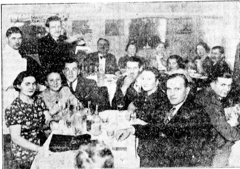
Vidám szilveszteri hangulat a Gambrinusban

(x) Irodai munkaerők kiképzése. A Naményi Gyorsíróiskolában folyik az irodai gyorsírók és gépiról szakszerű kiképzése. Január elején új tanfolyamok. Államvizsga, állami bizonyítvány, állásközvetítés. Helyesírástanítás, szépírástanítás külföldön is. (Batthyány-u. 11.)