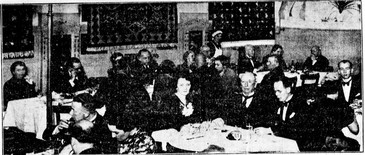
Az előkelőségek egyik asztala a bírói teán

— Ingyenes gyorsírótanfolyam. Naményi Gyorsíró- Gépiróiskola egyéb tanfolyamai mellett januártól ingyenes gyorsírótanfolyamot rendez a kitűnően bevált Naményi-módszerrel. (109 állami bizonyítványt, 8 200-ast, 16 gyorsírástanítói oklevelet, kerületi hőlgybajnokságot, kerületi szakiskolai bajnokságot szereztek az intézet növendékei. A Naményi-iskola a legtöbb pontot szerezte a tavaszi gyorsíróversenyeken Debrecen összes tanítói zetei között.) Az iskola végzett növendékeit el is helyezi. Eddig száznál több növendékét helyezte el hivatalokba, irodákba, vállalatoknál. Beiratkozni bármikor lehet. (Debrecen, Batthyány 11.)