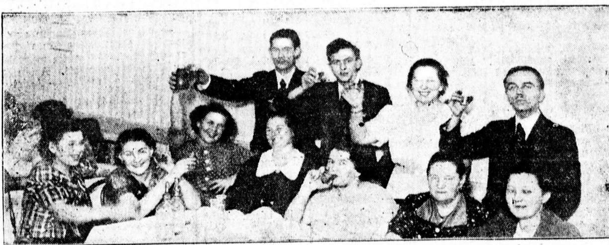
A vasutasok Szárnyaskerek Önképző és Önszervező Egyesületének kedélyes szilvesztere