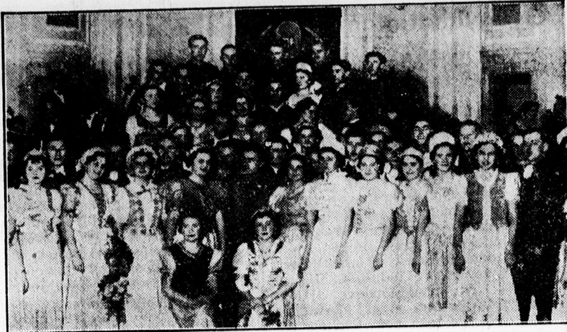
A Magyar Est közönségének egy csoportja az Arany Blka díszteremben

(x) Ne vegyen cseréncályhát addig, míg meg nem tekintette Krišch kályhás mester cseréncályha raktárát, ahol kitűnő, tűzálló, szép és olcsó cseréncályhák, kandallók vannak nagy választékban. Vállal minden e szakmába vágó munkát. Ispóaly-tér 1. sz. (Nagyállomás-nál). Telefon: 12-18.