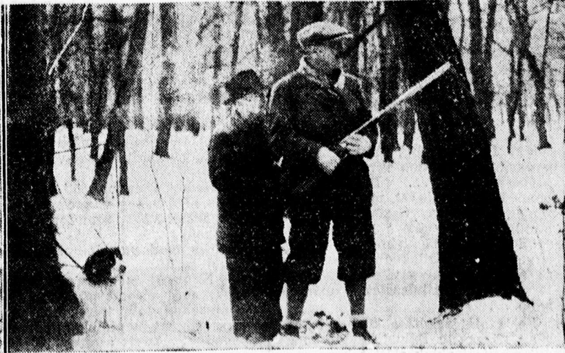
Fáy István főispán