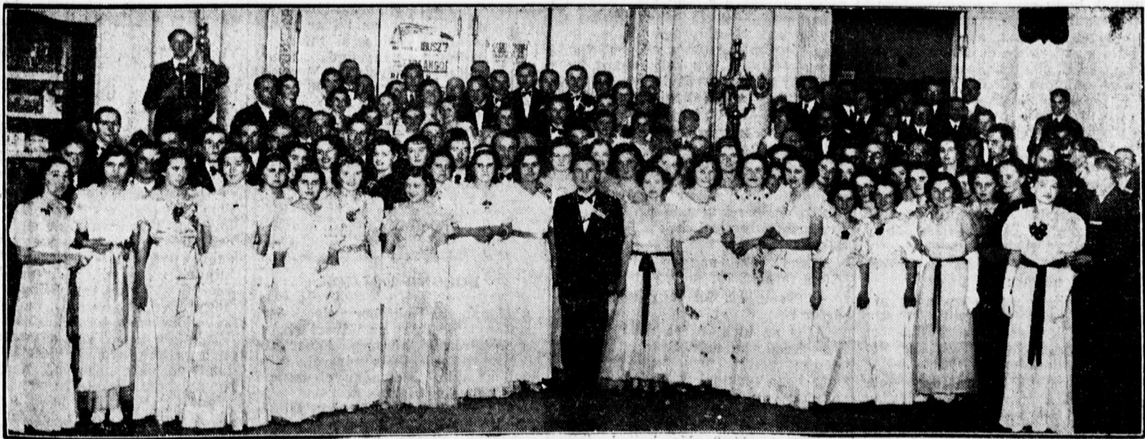
Az „Árpád” B. E. báljának első bálzóái az Arany Blikben

Kopenhága, február 11. Az itteni nemzetközi úszómérkőzés 2. napján a 400 méteres mellúszásban a német Heina 5.43.8 mp-es idővel világrekordot úszott. 1.2 mp-vel javította meg a dán Jensen eddigi világrekordját.