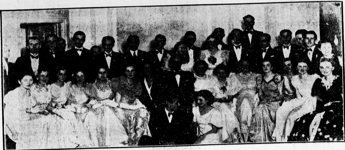
A Szent László teast nyitó párjál az Arany Blikában

(x) Ne vegyen cserépkályhát addig, míg meg nem tekintette Krisch kályhásmester cserépkályha raktárát, ahol kifűző, tűzálló, szép és olcsó cserépkályhák, kandallók vannak nagy választékban. Vállal minden e szakmába vágó munkát. Ispotyá-tér 1. sz. (Nagyállomás-nál). Telefon: 12-18.