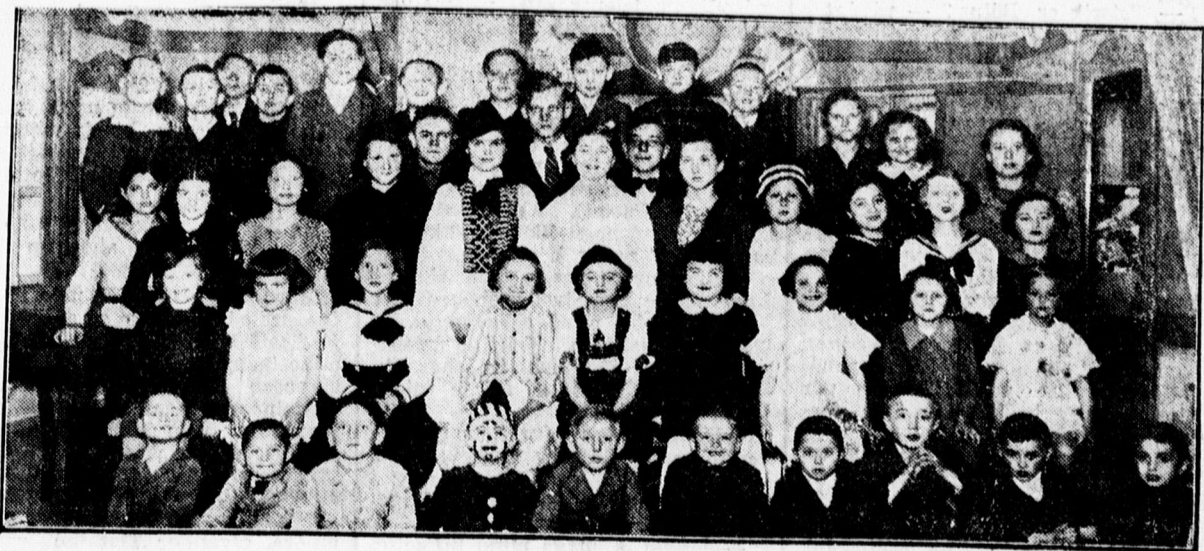
A „Gál Samu” gyermekszínház vidám műsoros délutánjának szereplői

A Csokonai-színház legutóbb a „Gázmérgezés a Domb-utcában” című riportdrámájával aratott és arat országos jelentőségű sikert. A darab és az előadás minden tekintetben méltó a Csokonai-színház multjához és tradíciójához. Reméljük, hogy ez a siker meg fog ismétlődni. „A legszebb tavasz”-szal is, amikor majd az operettgyűttes mutatja be tudását és tehetségét.