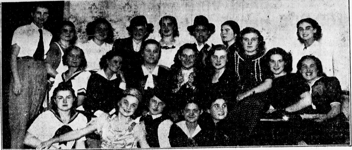
A Női Kerület előadásának szereplői