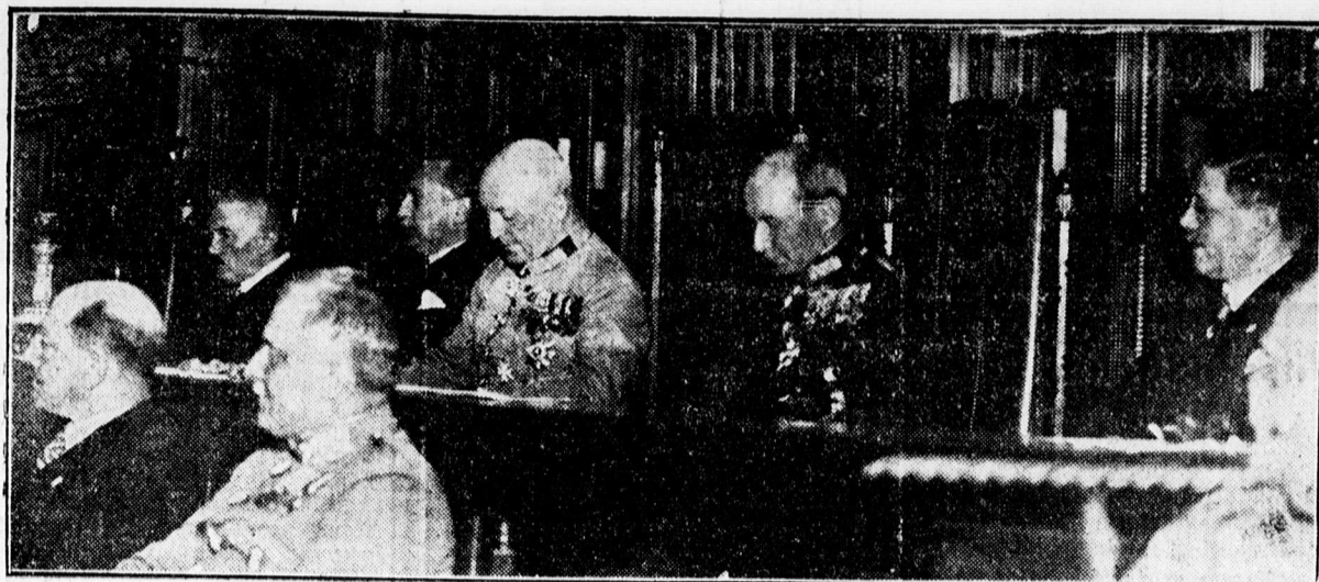
József főherceg a Légoltalmi Liga alakuló közgyűlésén