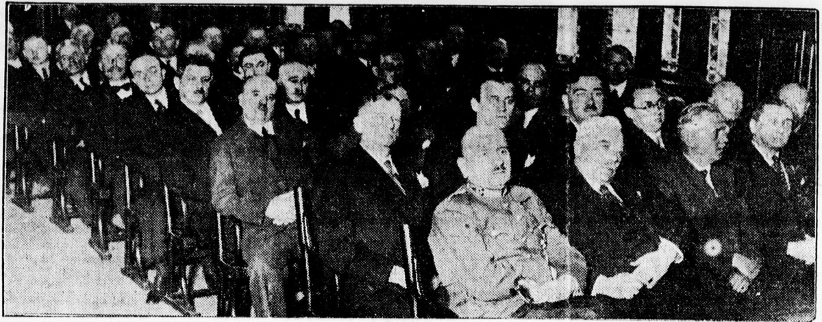
A Baross Szövetség közgyűlése