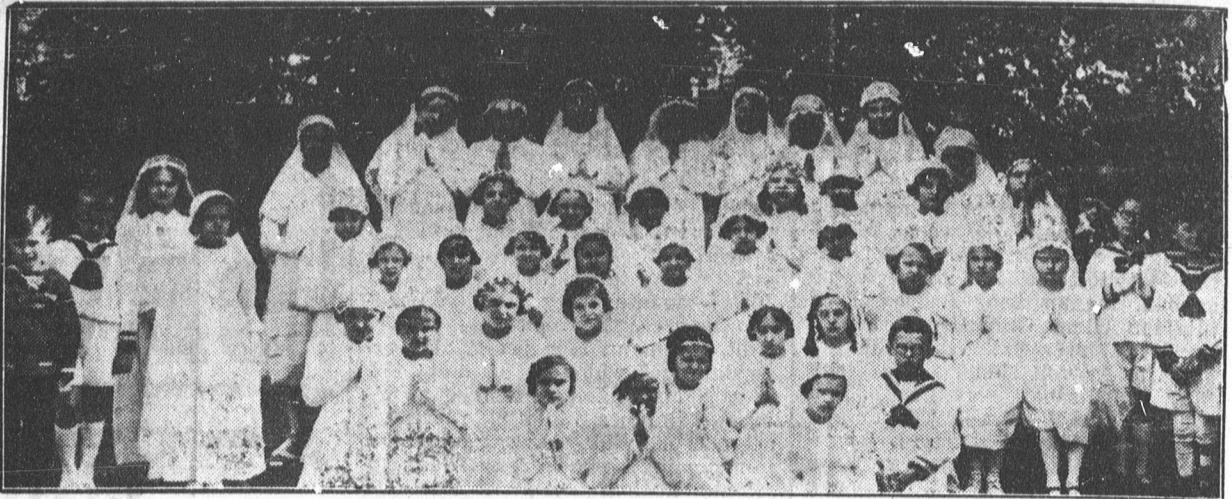
Elsőáldozók a Svetitsben