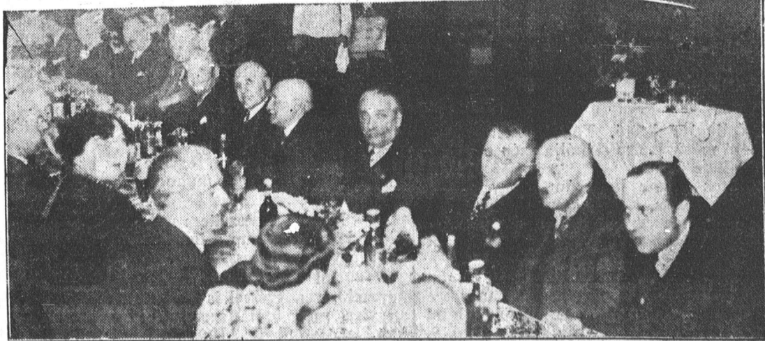
A magyar közlekedési vállalatok vezetőinek bankettje az Arany Blakában.

A rendőrség a veszedelmes nemzetközi zsebmetszőt őrizetbe vette a kihallgatása után átkísérik az ügyészégre fogházba, ahol tiltott határátlépés miatt indítanak ellene eljárást. Úgy látszik, a veszedelmes zsebmetszőnek Debrecen mindig vesztét jelenti, mert még csak kétszer fordult itt meg és mindkét alkalommal rendőrkézre került.