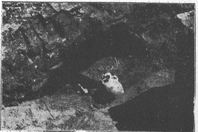
Egy feltárt sír