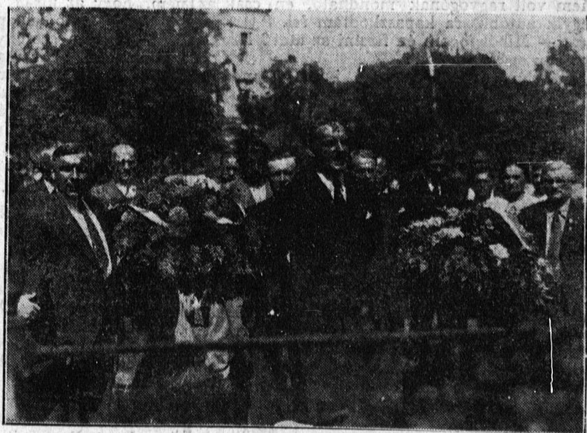
Az Amerikai Református Egyesület Debrecenben tartózkodó tagjai megkoszorúzzák a Kossuth-szobrot és a Gályarabok emlékoszlopát