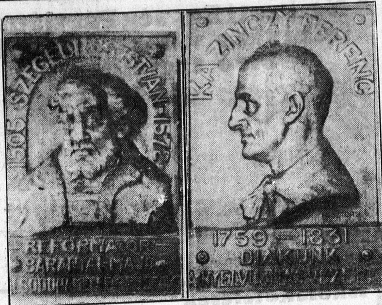
Szegedi Kiss István és Kazinczy Ferenc emléktáblái a Kollégium falán

— Gyógyíthatatlan betegsége miatt felvágta ereit egy asszony. Lévi Gézáné Kassa-út 32. szám alatti lakos vasárnap délután lakásán egy óvatlan pillanatban előrántott egy hatalmas könyvhéskést és azzal felvágta ereit. A házbeliek azonnal telefonáltak a mentőkért, akik a szerencsétlen asszonyt első segélynyújtás után kiszállították a sebészeti klinikára. Lévinét a klinikán ápolják, állapota súlyos, de nem életveszélyes. Az öngyilkossági kísérletről jelentést tettek a rendőrség sérülési osztályán is. A rendőrség a nyomozás során megállapította, hogy Lévi Gézáné gyógyíthatatlan betegsége miatt akart megválni az élettől.