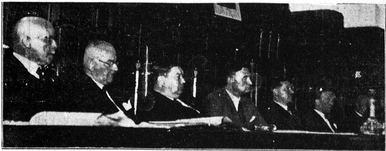
Az Országos Igazos Kongresszus elnöksége

Kedvező részletfizetés. Takarékosságra is. Alapítási év: 1876.