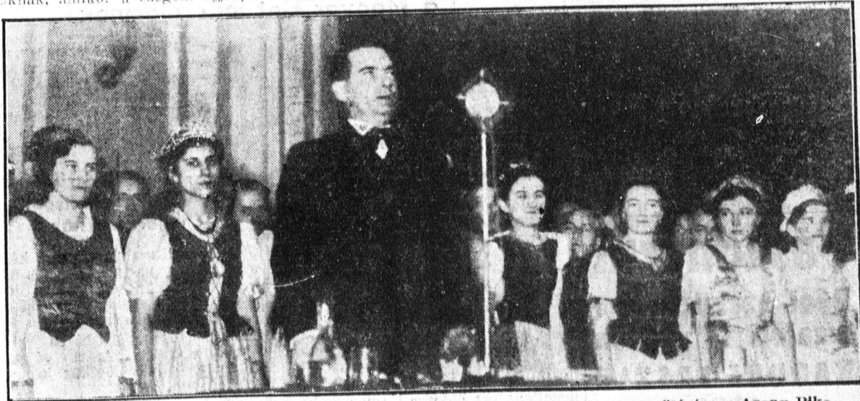
Jaross Andor felvidéki miniszter beszédét tartja a Magyar Élet Mozgalom nagygyűlésén az Arany Bika dísztermében.

És végezetül a tiszántúli zászlóbontás a legszebb elégtételt adta még Jaross Andor felvidéki miniszternek az ellene kirobbant méltatlan gáncsvetésekre. A Magyar Élet Mozgalom meghódította Debrecen és a Tiszántúl népét és tettekész egységbe kovácsolta az elkövetkezendő nagy feladatok munkavállalására.