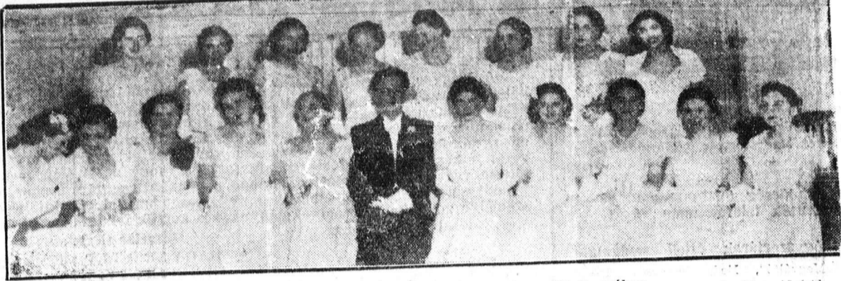
Első bálózók a jogászbálon az Arany Bika dísztermében