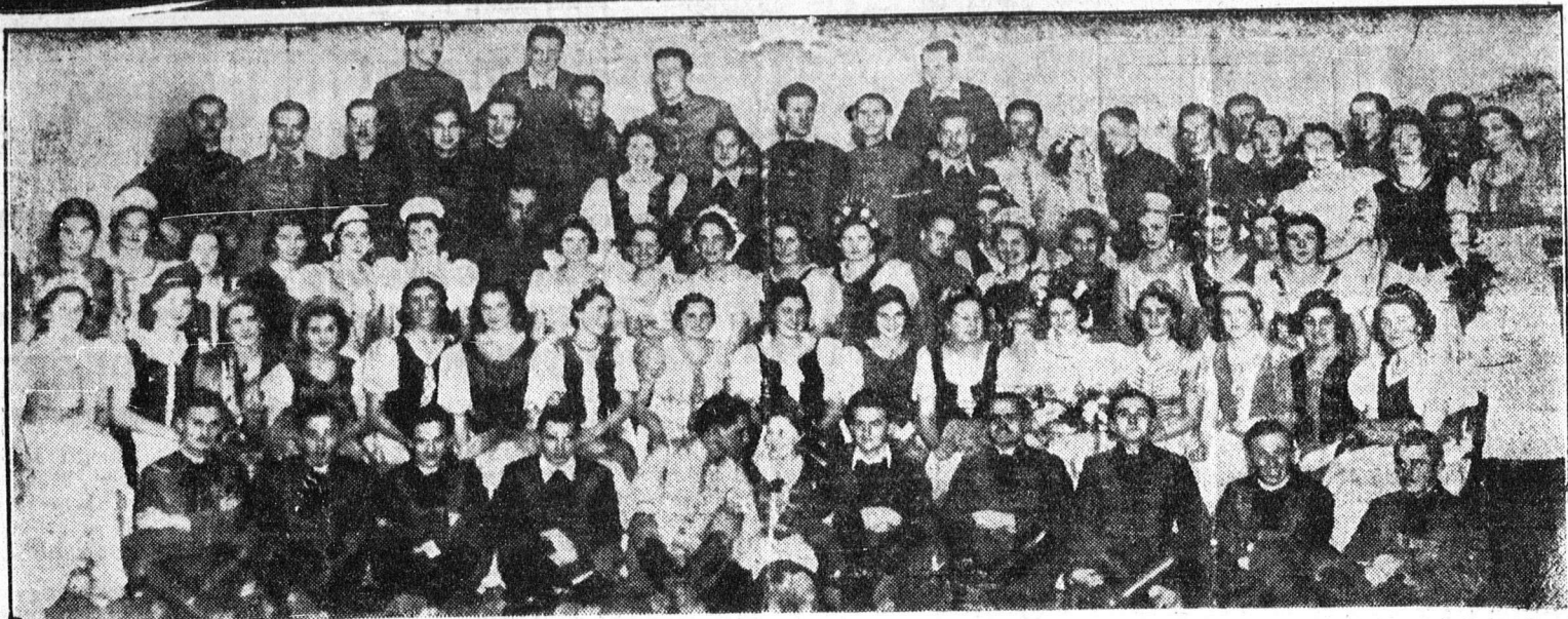
A palotástán coló párok az Arany Bikában tartott Magyar Esten